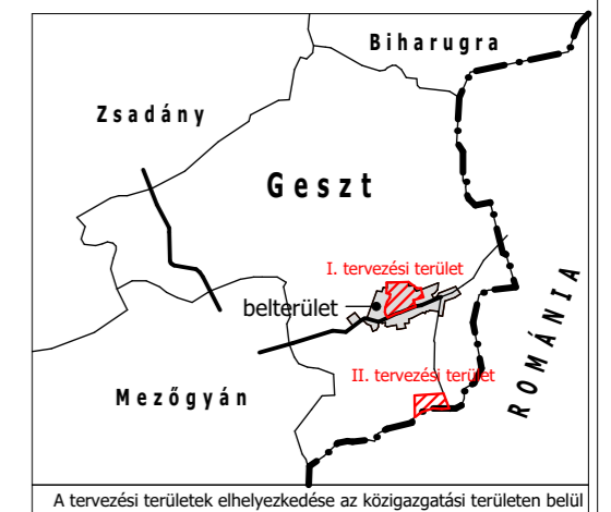
A tervezési területek elhelyezkedése az közigazgatási területen belül