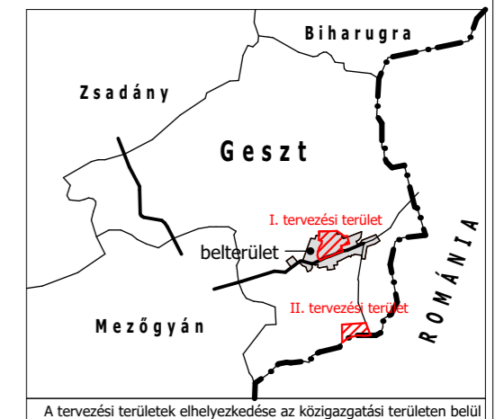
A tervezési területek elhelyezkedése az közigazgatási területen belül